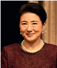
Masako Owada, impératrice consort du Japon