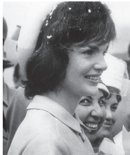
Jacky Kennedy, ancienne Première dame des USA