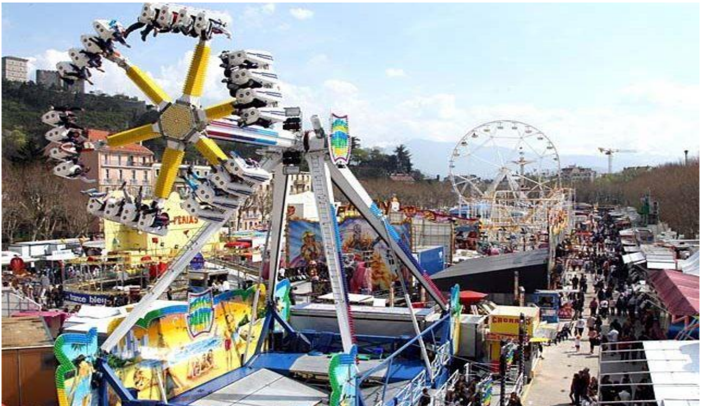
La foire des rameaux : du 14 avril au 5 mai 2025 à l'esplanade de Grenoble, comme chaque année depuis un siècle

Le mois d'avril à Grenoble est synonyme de printemps. Mais, comme le dit le proverbe « Avril ne te découvre pas d'un fil...Mai, fais ce qu'il te plaît ». Cela signifie que l'hiver se prolonge parfois à Grenoble durant le printemps, même si les arbres fleurissent et que la verdure réapparaît, les « giboulées de mars » rendent habituellement la météo instable : soleil, chaud, froid, neige, retour de gel, tout se mélange durant le mois d'avril alors n'oubliez pas de vous vêtir afin de ne pas prendre froid 😊 Le mois d'avril est aussi pour les Grenoblois l'arrivée de la foire des Rameaux, les manèges à sensations pour petits et grands font leur retour durant 3 semaines sur la place de l'Esplanade (porte de France). Allez-y en groupes, en semaine comme le weekend !