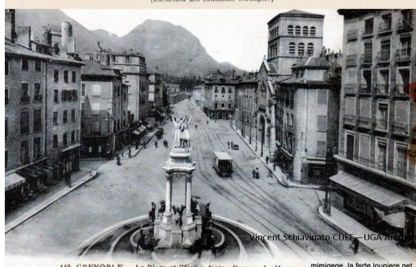
149. GRENOBLE — La Place et l'Eglise Notre-Dame — Le Monument aux Morts.