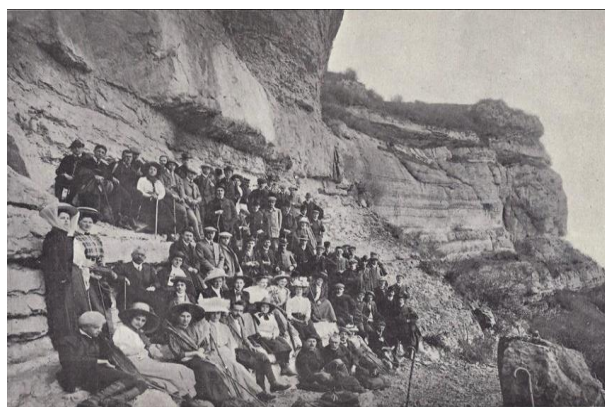
PLATEAU DES PETITES-ROCHES (massif de la Chartreuse) (Excursion des Étudiants Étrangers)